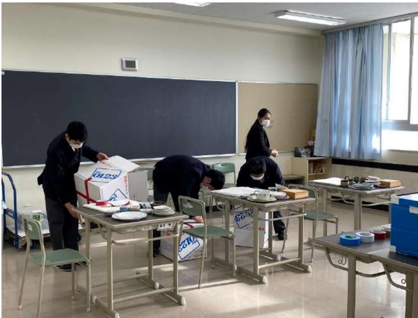
梱包作業をしている様子