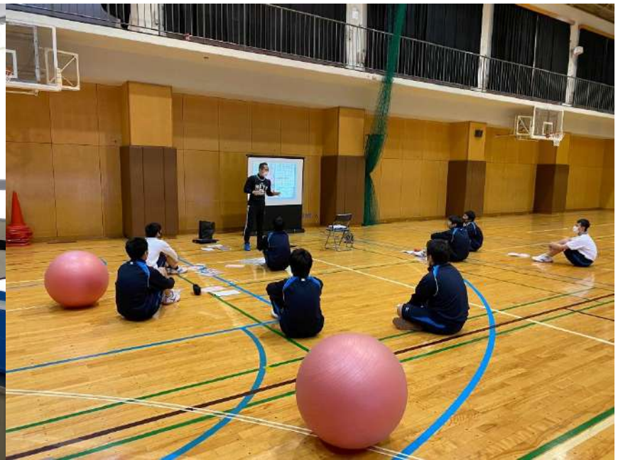
「スポーツ」インストラクターの方のお話