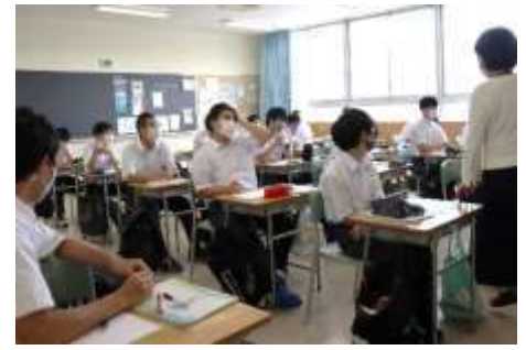
3組 (システム工学科)