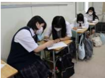
4組 (デザイン工学科)