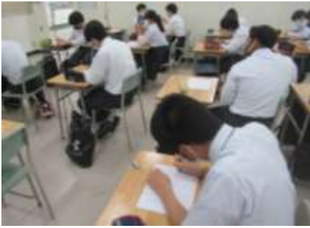
1組 (プロダクト工学科)