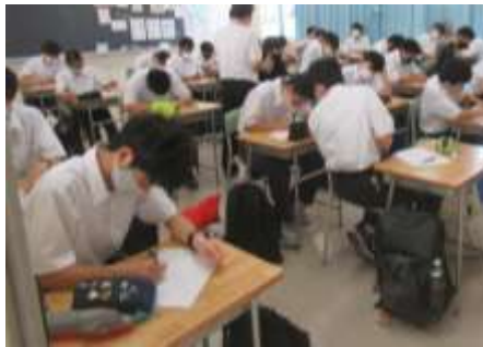
2組 (オートモビル工学科)