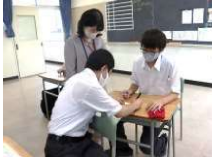
5組 (デュアルシステム科)