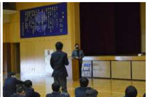
しつぎおうち 質疑応答