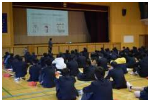
ぜんたい ようす 全体の様子